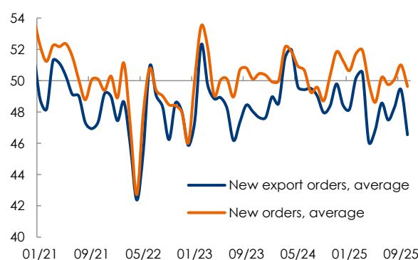
Fig. 2 – PMI: ordini totali e ordini esteri, media NBS – RatingDog