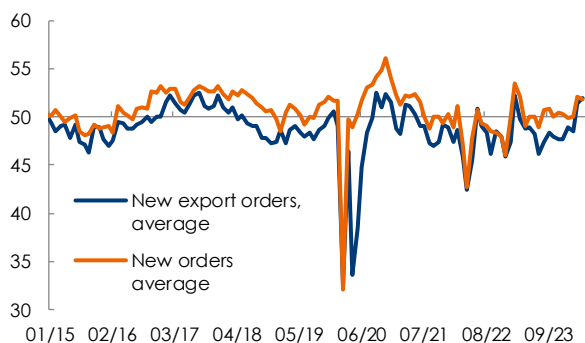
Fig. 3 – Indici PMI: ordini totali ed esteri, media Caixin e NBS