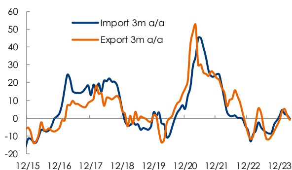
Fig. 1 - Commercio estero

Il surplus commerciale è salito da 58,6 miliardi di dollari in marzo a 72,4 miliardi in aprile, portando il surplus nei primi quattro mesi del 2024 a 255,7 miliardi di dollari, 10,3 miliardi in meno rispetto allo stesso periodo del 2023.