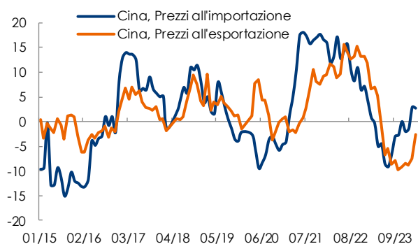
Fig. 2 - Prezzi di import ed export - var. a/a