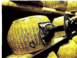
TUTELA DEI MARCHI

L'Italia ha il maggior numero di certificazioni alimentari nella Ue, con 273 prodotti Dope Igp. Per questo – e per le conseguenze sulla salute dei consumatori e dell'ambiente – le linee guida per la riforma prevedono che le politiche di tutela dalla contraffazione dei prodotti alimentari siano distinte da quelle di generica tutela dei marchi